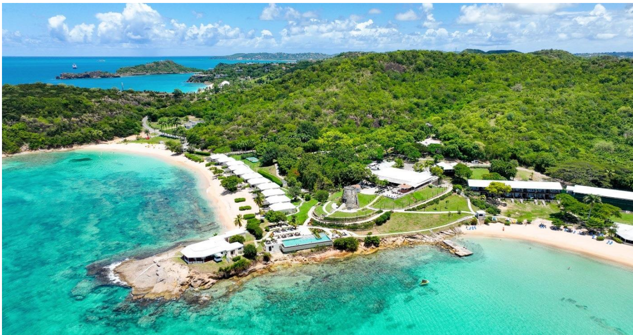
Hawksbill Resort Antigua

Dal 14 al 27 agosto 2025 Partenza da Roma